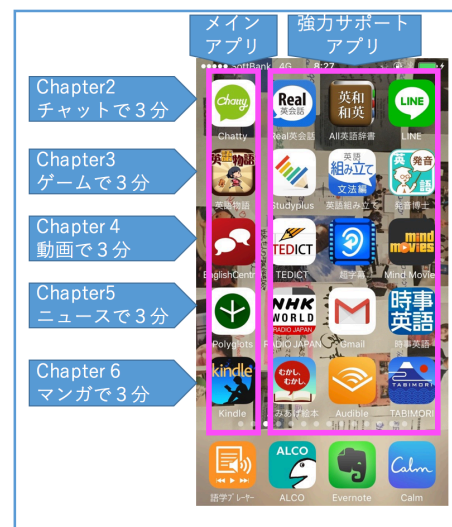
英語学習ホーム画面をスマホ上に作る (P013)

・「スマホ英語学習ホーム画面」を作ることによって英語学習を始めて続けるのが簡単になります。